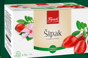
ČAJ ŠIPAK Franck, 20x3g, pak