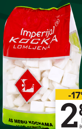
IMPERIJAL KOCKA lomljena, 1kg