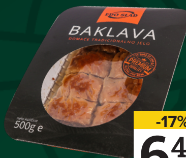
BAKLAVA kolač, Edo-slad, 500g