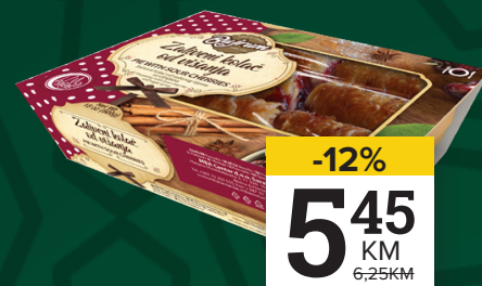
ZALIVENI KOLAČ od višanja, Bujrum, 500g