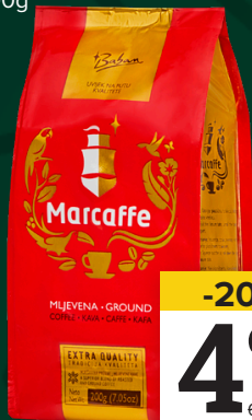
MARCAFFE kafa mljevena, 200g