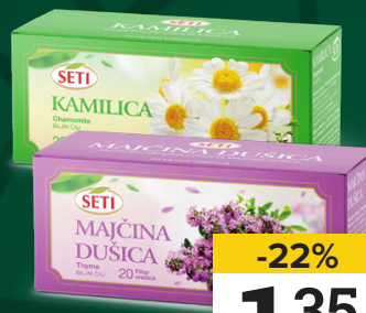
SETI čajevi, razne vrste, 20/1, 20g, 30g, pak