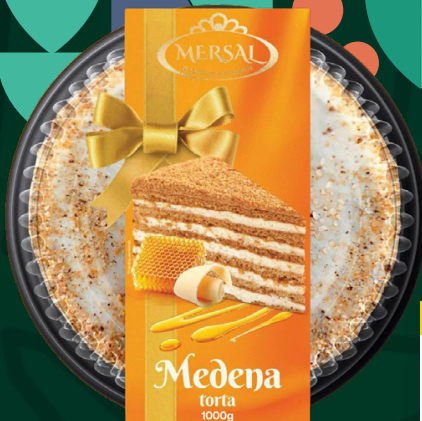
TORTA MEDENA Mersal, 1000g