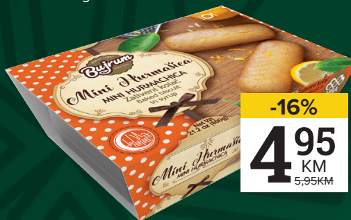
HURMAŠICA MINI Bujrum, 600g