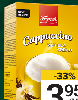
CAPPUCCINO vanilija, 148g, Franck